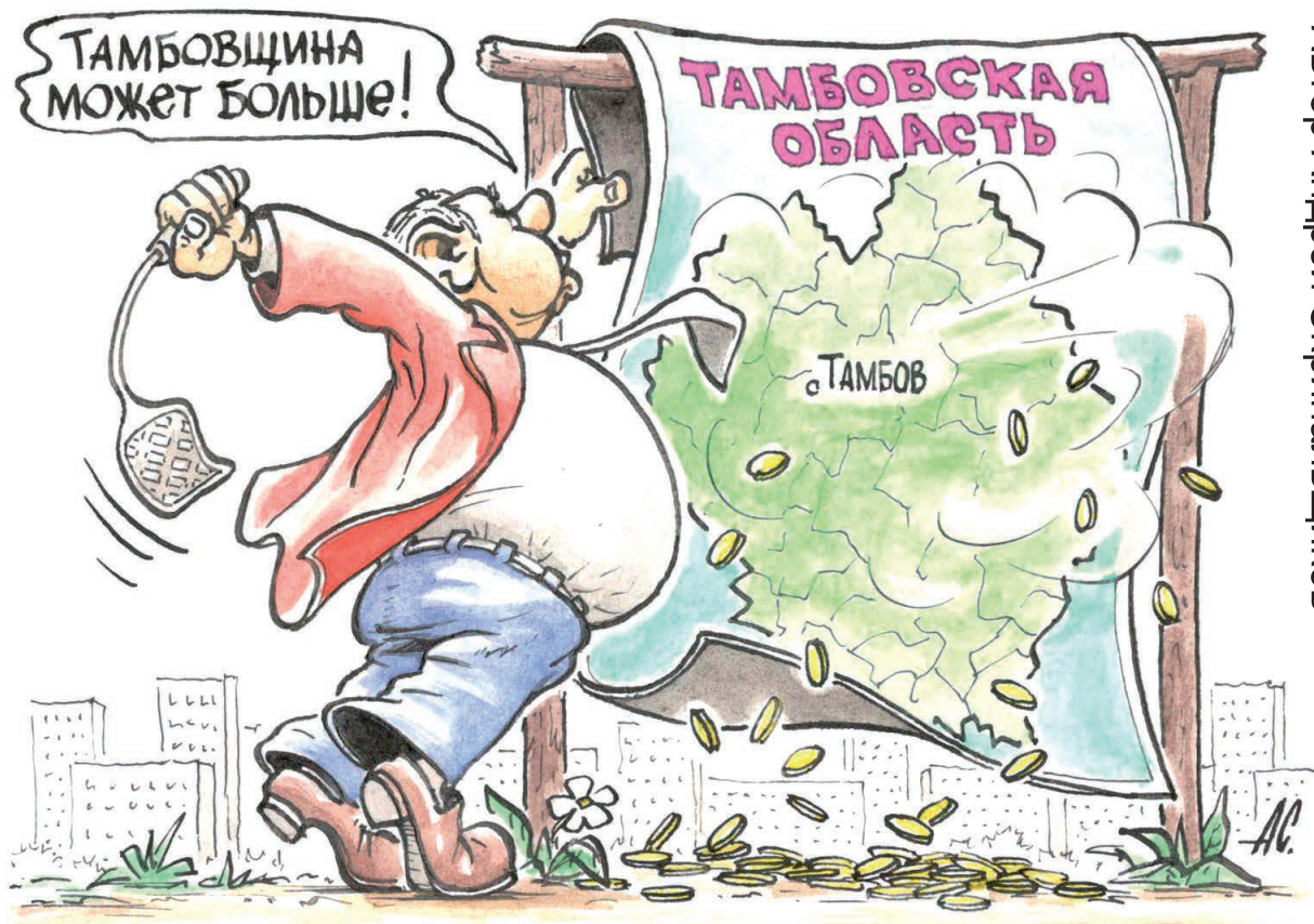
Автор Андрей Скрипальщиков