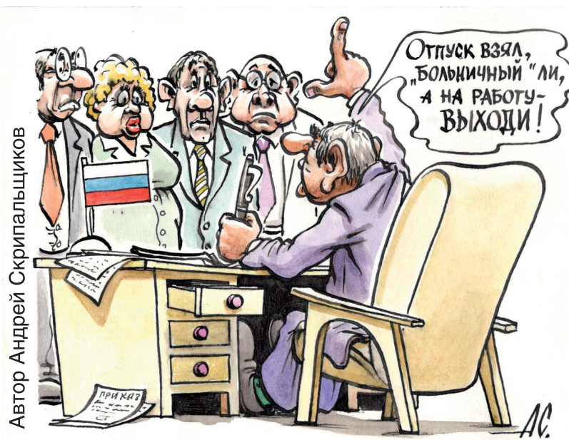
Автор Андрей Скрипальщиков