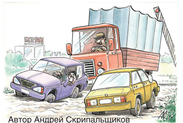
Автор Андрей Скрипальщиков

300 метров автодороги под Тамбовом «Ловинский кордон - Бокино» оказались, по видимому, нейтральной территорией. От спора чиновников страдают водители, разбивающие в жутких выбоинах свои машины.