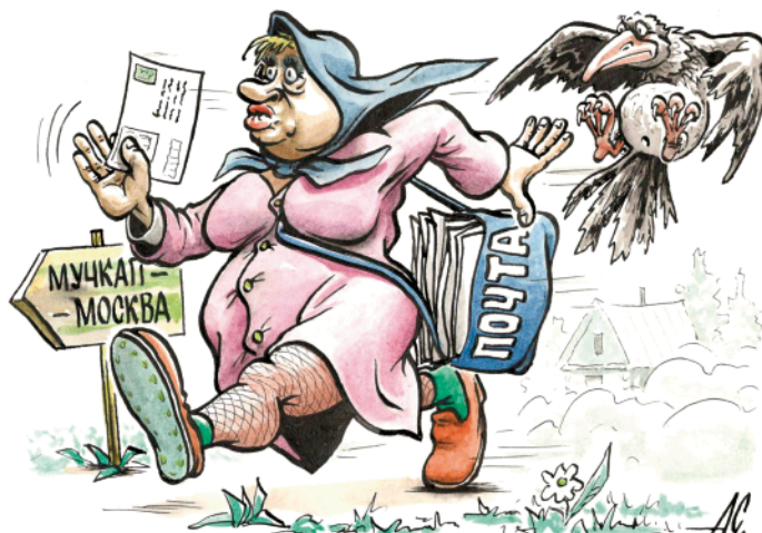
Автор Андрей Скрипальщиков

месяц-полтора, прокручивая деньги стариков и инвалидов, явно не в их пользу.