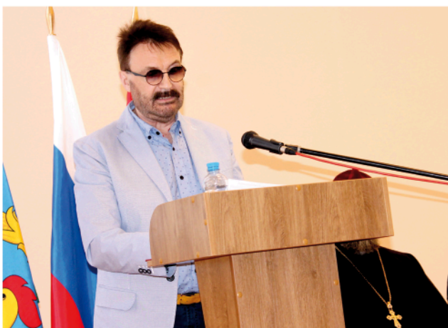
Зачитывается поздравительный адрес Председателя партии СПРАВЕДЛИВАЯ РОССИЯ Сергея Миронова

Его направил Председатель партии СПРАВЕДЛИВАЯ РОССИЯ Сергей Миронов.